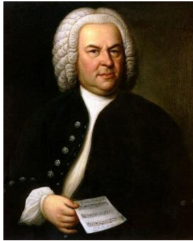
Resim 1: Johann Sebastian BACH 1685-1750