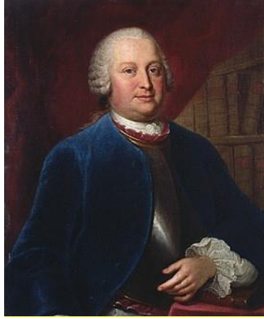
Resim 2: Johann Gottlieb GOLDBERG 1727-1756 (Music Metason, 2023)