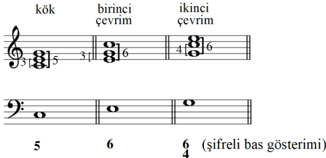
Notasyon 1: Beşli Akorların Şifreli Bas ile Gösterimi

Şifreli bas (İng. figured bass ); bir akorun bas sesiyle, üzerinde bulunan diğer sesleri arasındaki mesafeleri gösteren ve o bas sesi üzerine hangi tür ve çevrim pozisyonunda akor kurulması gerektiğini belirten armonik uygulamalarda kullanılan bir yöntemdir. Alman ve Fransız olmak üzere iki farklı şifreleme yöntemi kullanılmaktadır (Avşar, 2022: s.18). Bu çalışmada da kullanılacak olan Alman şifreleme yönteminde, şifre rakamları ve rakamların yanına konan değiştirici işaretlerle birlikte (eğer işaret üçlüye konacaksa, rakamsız verilir) akor kurularak türü ve pozisyonu belirlenir. Bu yöntemde akor türü değişse de şifre değişmez. Aşağıdaki notasyonlarda bu çalışmanın içeriğinde bulunan iç sesli beşli akorların (bkz. Notasyon 1) ve dört sesli yedili akorların (bkz. Notasyon 2) şifreli bas rakamları Fa anahtarı kullanılarak verilmiş ve açılımı da üzerinde Sol anahtarı kullanılarak gösterilmiştir.