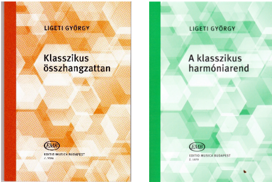
Resim 2: Klasszikus Összhangzattan ve A Klasszikus Harmóniarend

teorisyen ve eğitimci olarak üstün ve üretken özelliğini ortaya koymaktadır. Almanya'ya yerleşmeden önce 1950-56 yılları arasında Budapeşte Müzik Akademisi'nde ders verirken 1954 yılında kaleme aldığı “Klasszikus Összhangzattan” ve “A Klasszikus Harmóniarend” (Macarca “Klasik Armoni” anlamında gelen) kitapları onun bu özelliğini kanıtlamaktadır. Yazıldığından günümüze üzerinden atmış dokuz yıl geçmesine rağmen Macaristan'daki başta Franz Liszt Müzik Akademisi ve bu akademiye bağlı Zoltan Kodály Pedagoji Enstitüsü olmak üzere bu kitap birçok müzik okulunda eğitimler tarafından halen temel kaynak olarak kullanılmaktadır. Macarca dilde yazılan ve iki kitap şeklinde birbirine entegreli olan bu kaynaklar, klasik armoni konularını kapsamaktadır. Aslında tek bir kitabın iki farklı modüler parçası şeklinde de düşünülebilir. Birinci kitapta belirli bir konu akışına bağlı akor yürüyüşü ve şifreli bas çalışmaları, ikinci kitapta ise yine bu konu akışına bağlı eser armonik analizleri bulunmaktadır. İki kitap da konu akışı bakımından birbirlerine paralel ilerlemektedir. Kitaptaki konuları genel çerçevede özetleyecek olursak, belirli bir takım temel müzik kuramları, üç-dört-beş sesli akorlar, bu akorların birbirlerine olan bağlantıları, akor yürüyüşü, şifreli bas ve eser armonik analizi çalışmalarıdır. Kitapların yeniden düzenlenerek Editio Musica Budapest tarafından 2014 yılında basılan en güncel kapak resimleri aşağıda verilmiştir: